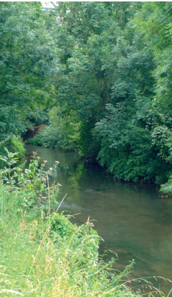
Der Fluss Die Göhl